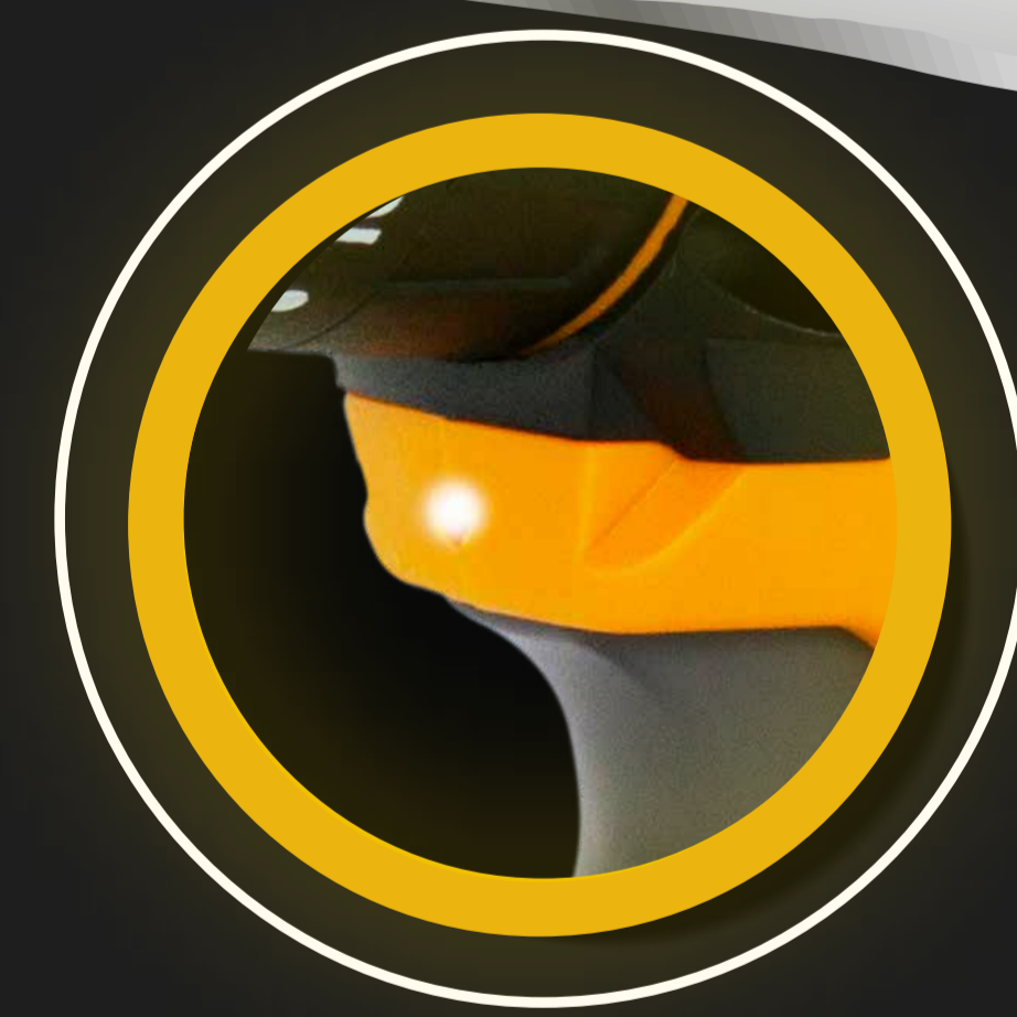
LUZ L.E.D. DE TRABAJO