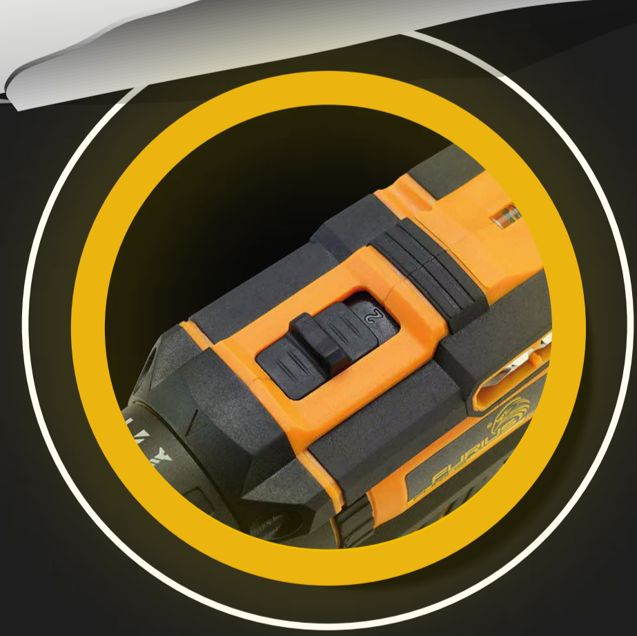
SELECTOR DE 2 VELOCIDADES