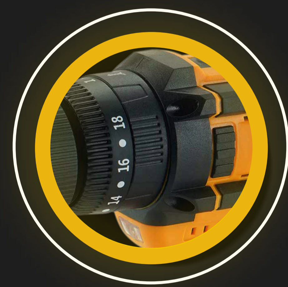
PERCUTOR - ROTACIÓN CON 18 AJUSTES DE TORQUE